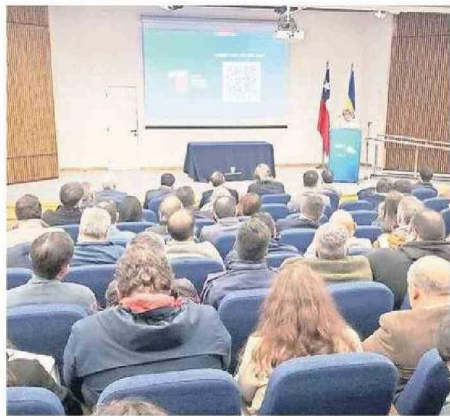
LA MINISTRA DEL MOP, JESSICA LÓPEZ, DURANTE SU INTERVENCIÓN.