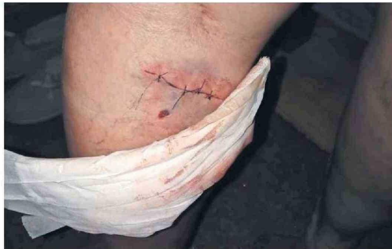
AHORA ESTÁ EN CURACIÓN Y CON PUNTOS PRODUCTO DE LA HERIDA CAUSADA POR EL PERRO.

También detalló cuáles son los pasos a seguir en caso de ser mordido por un animal. “Es fundamental que la comunidad sepa que, si una persona es mordida por un animal, de