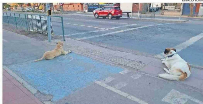
LA MUJER AFECTADA SEÑALÓ ESTAR PREOCUPADA POR LA CANTIDAD DE PERROS EN EL SECTOR.

EN COPIAPÓ. La mujer fue atacada cuando salía de la Universidad de Atacama y terminó en la Urgencia. Desde la Seremi de Salud llamaron a la población a acudir a un centro de salud en estos casos.