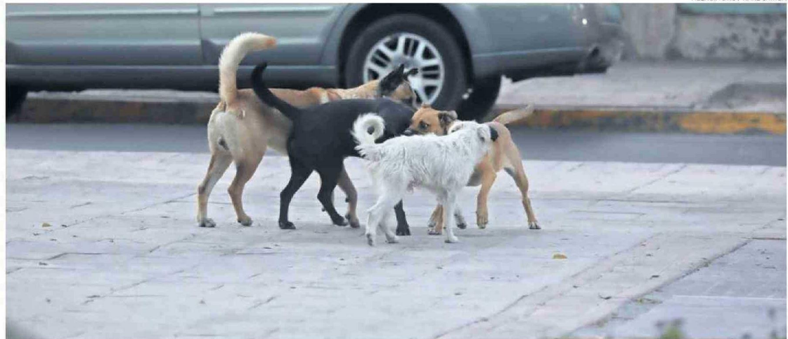
SEREMI DE SALUD RECALCÓ CUÁLES SON LOS PASOS A SEGUIR EN CASO DE SER ATACADO POR UN PERRO, TAMBIÉN DETALLÓ EL TRABAJO REALIZADO EN EL TERRITORIO.

Desde la organización de voluntarios animalistas 'Pe-