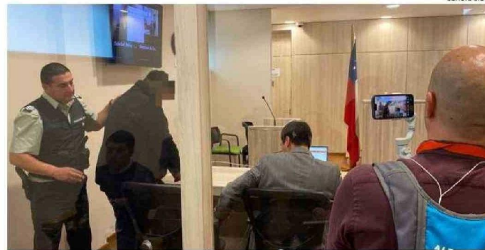
EL JUEVES SERÁ LA FORMALIZACIÓN DEL PATRÓN DE LA EMBARCACIÓN SINIESTRADA.

Tras esta tragedia, existe preocupación sobre la fiscalización y la capacidad de pasajeros que pueden transportar este tipo de embarcaciones.