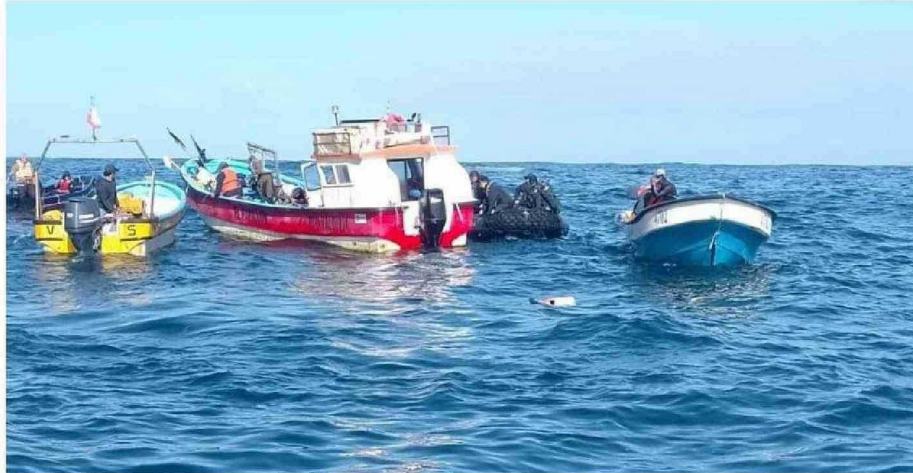
CERCA DE LAS 10 DE LA MAÑANA, SE HIZO EL HALLAZGO DE LA EMBARCACIÓN Y DE LOS TRES CUERPOS RESTANTES QUE FALTABAN POR UBICAR.