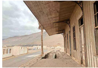
RESTOS. La antigua estación, construida en pino Oregón. También queda la huella por donde pasaban los rieles.

Bajo el mar, otro tesoro aguarda más investigación. "Ya conocemos al menos tres pecios, es decir restos de naufragios que yacen en la bahía y con toda seguridad pertenecen a la era salitrera", dice Christophe Pollet, que es investigador del Instituto de Arqueología Náutica y Subacuática (IANS). "Hay dos embarcaciones de las que venían