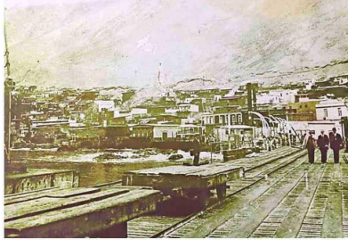
FERROCARRIL. Llegaba hasta los muelles de la bahía, donde se embarcaban el salitre y otras mercancías.