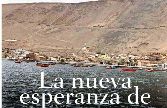
POSTAL. El pueblo, visto desde el mar, se guarece bajo los cerros desnudos del desierto nortino.