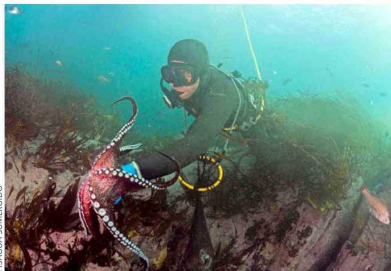
ENCUENTRO. Un buzo y un pulpo durante una de las inmersiones en el área marina.