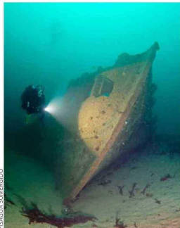
ROSS SHIRE. Este velero de la época del salitre yace a pocos metros bajo la bahía.

Aunque pareciera que la caleta quedó congelada en el tiempo, durante el siglo