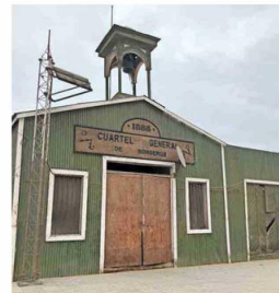
CUARTEL. El edificio central de bomberos data de 1888.

¿Dónde se metió toda la gente? La respuesta está un par de kilómetros al norte, en el cementerio: una silenciosa ciudadela de cruces de madera apolillada. En su mayoría, los nombres en las tumbas se han