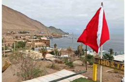
COMUNIDAD. Unas 300 personas viven en el pueblo, que espera tiempos mejores.

Marcos y Tamara llegaron por primera vez en 2003 atraídos por los peces, y también escapando de la gran ciudad. "Pisagua es un lugar donde afortunadamente no hay mucha intervención relacionada con emisarios u otro tipo de instalaciones invasivas o contaminantes. Entonces los sectores aledaños son reconocidos por te-