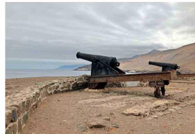
CAÑONES. Alguna vez defendieron infructuosamente la bahía de Pisagua, que fue protagonista de dos desembarcos.

a cargar nitrato y que son de las más grandes del mundo para la época. Cada una constaba de cuatro palos y tenían unos 85 metros de eslora y unos 12 metros de manga. Además de constituir un sitio patrimonial de interés, son un punto de buceo muy interesante, ya que están a poco más de 30 metros de profundidad, y en un lugar de fácil acceso, a escasos metros del muelle de Pisagua", destaca.