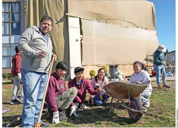
O'HIGGINS. — La comunidad del colegio Trichahue, en Requinoa, inició la limpieza de sus instalaciones, dañadas por la quebradura de vidrios, producto de las fuertes e inusuales ráfagas de viento.

También detalló que en la región de O'Higgins existe interrupción de conectividad en cinco rutas, por la activación de quebradas y aumento de caudales en Santa Cruz. En tanto, informó que en Maule se generó un socavón en la ruta M-854, en Cauquenes, y se registran otras dos rutas alteradas por el desborde de canales. En Biobío, alertó de 800 clientes sin agua en la comuna de Tomé, debido al deslizamiento de ladera que rompió planta de agua potable. En la comuna de Requinoa, en