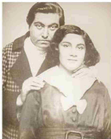
Gabriela Mistral con una alumna de 1925.