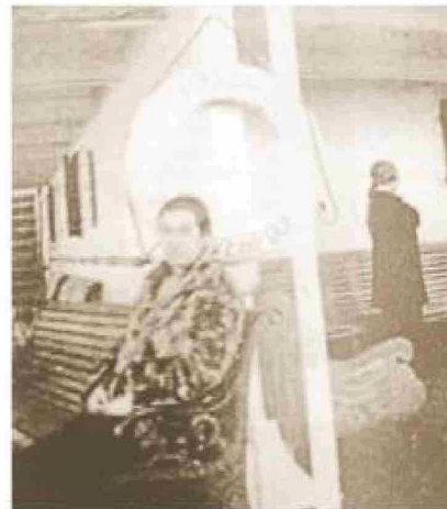
Gabriela Mistral en el barco Oropesa II.