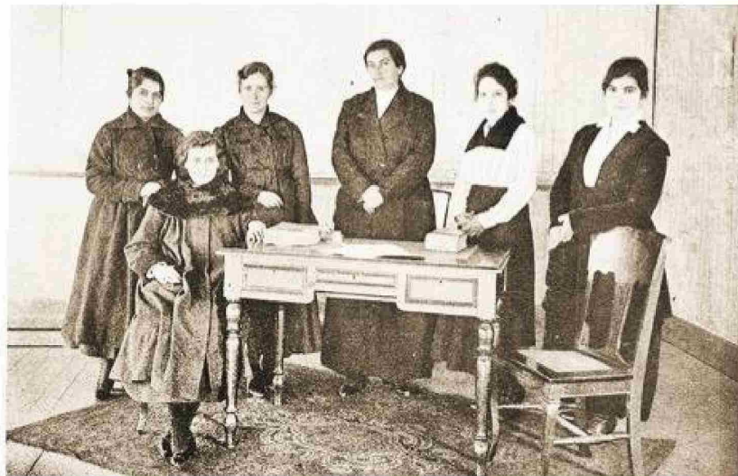
Señorita Lucila Godoy (Gabriela Mistral), directora del Liceo de Niñas (1920) de Punta Arenas, junto a profesoras del mismo establecimiento.