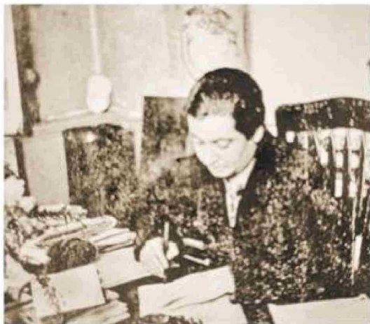
Gabriela Mistral en Magallanes.

Tiraje: 3.000 Lectoría: 9.000 Favorabilidad: No Definida