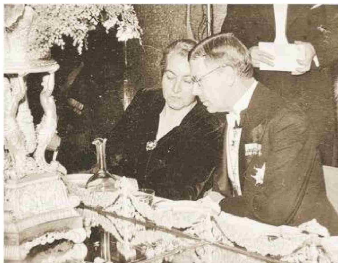
Ceremonia de entrega del Premio Nobel de Literatura a Gabriela Mistral en 1954.