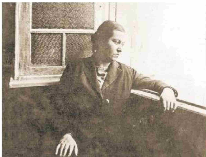
Gabriela Mistral nació el 7 de abril de 1889 en Vicuña.

Durante su gestión en el Liceo de Niñas de Punta Arenas, matriculará al doble de las alumnas que sus antecesoras en el cargo; creará una biblioteca popular; organizará y dirigirá la Escuela Nocturna enseñando a leer y escribir a las mujeres que accedan a la Sociedad de Instrucción Popular; propondrá la reforma educacional para todos los estudiantes de la región y la flexibilización del calendario escolar en consideración de la crudeza de la época invernal, naciendo las vacaciones escolares de invierno. El que igualmente se