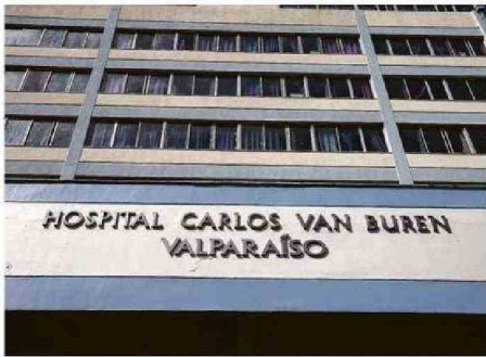
DESDE EL HOSPITAL PORTEÑO NO EXISTIÓ RESPUESTA AL CASO.

Sin perjuicio de ello, “al no recibir tan buena aten-