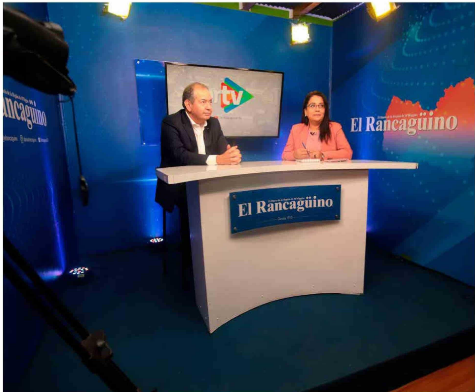
También puede encontrar esta entrevista en nuestro canal de Youtube, El Rancagüino TV.

capacidad de ahorrar de un país porque permite que otros inviertan y uno reciba sus intereses por guardar esta platita, juntarla para el futuro o para lo que sea. Entonces, cuando uno presta una plata, tiene que asegurarse bien que va a retornar. Y ahí se tiende a juzgar que la banca es un poco compleja porque no llega y presta la plata, porque no es nuestra. Y eso hay que entenderlo desde el comienzo. Chile es de los países más bancarizados de América Latina con un 90%, por lo tanto, acceso hay. Uno podrá cuestionar que en algunos giros o rubros, por ejemplo, el inmobiliario y construcción, y que efectivamente han salido distintas autoridades a cuestionar, que los bancos no prestan plata, cosa que es un poco mirado de afuera criticable. Pero es que la realidad de esos sectores ha estado más compleja. Y también tiene mucha responsabilidad la autoridad o quien dirige el país, porque tienen que ser capaces de dar las facilidades para ello también.