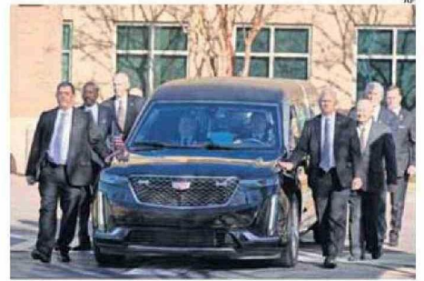
EXAGENTES DEL SERVICIO SECRETO ACOMPAÑARON LA CARROZA FÚNEBRE.