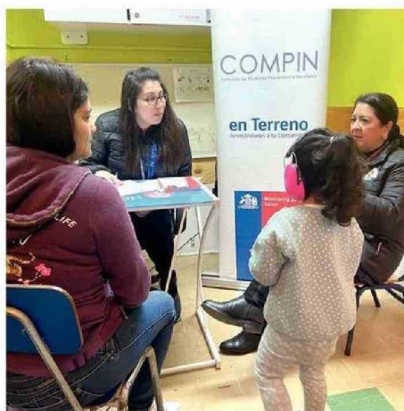
SE EVALUÓ EL GRADO DE DISCAPACIDAD DE LOS NIÑOS.

"A partir de esta resolución de discapacidad emitida por Compin, las