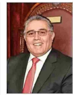
Juez se desempeñó en las cortes de Santiago y Copiapó.

"¿Sin líneas rojas?" Cómo llegan el PC y el FA a cruciales votaciones, luego de las modificaciones a aspectos intratables para el bloque.