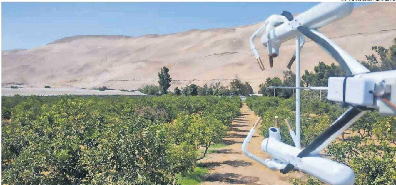
PROYECTO "PLATAFORMA CARBONO CONTROL: MONITOREO PÚBLICO DEL DIÓXIDO DE CARBONO EN LA REGIÓN DE ARICA Y PARINACOTA", ENTREGARÁ INFORMACIÓN VALIOSA PARA LA ACTIVIDAD AGRÍCOLA.