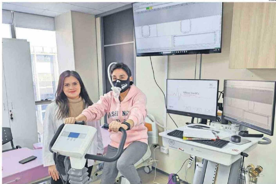
LAS PARTICIPANTES REALIZAN UNA SERIE DE RUTINAS, ENTRE ELAS DE TIPO INTERVÁLICO DE INTENSIDAD VIGOROSA EN UNA BICICLETA ESTÁTICA.

Tanto este tipo de cáncer como otras patologías cardiovasculares se agravan por el sedentarismo, que es la falta de actividad física y un estilo de vida inactivo. Esto es, detalla Álvarez, en no practicar actividad física de baja a mode-