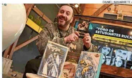
EL PERIODISTA ROCKSTAR TRAJÓ TÍTULOS ERÓTICOS Y DE ANIMÉ.