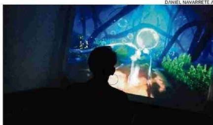
EL JUEGO INTERACTIVO APANGORA FUE HECHO EN ECUADOR.