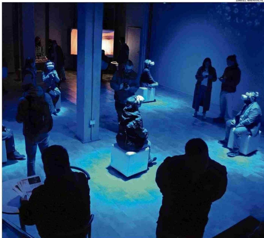
EN LA SALA CENTRAL DEL SUBSUELO DEL MUT EL PRINCIPAL ATRACTIVO SON LAS GAFAS DE REALIDAD VIRTUAL.

tada; en la Sala 7, un juego interactivo sobre medio ambiente llamado “Apangora”; y en la Sala Central del subsuelo, obras de realidad virtual.