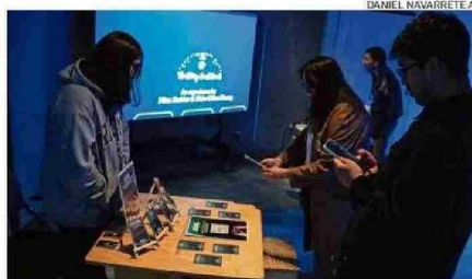
HASTA MAÑANA SE PODRÁ VISITAR LA MUESTRA GRATUITAMENTE.