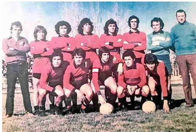
Rangers 1979: Capitán y, goleador del equipo con 10 goles.