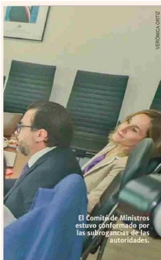
El Comité de Ministros estuvo conformado por las subrogancias de las autoridades.