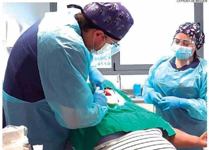
CAPTURA DE IMAGEN

“Estimamos que estas horas serán asignadas en un plazo corto, toda vez que proteje-