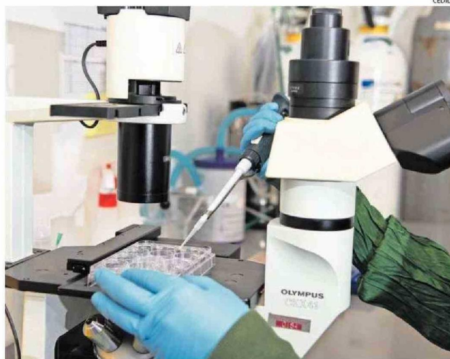
LOS TEJIDOS HUMANOS, EXTRAÍDOS TRAS UNA CIRUGÍA, SON AUMENTADOS IN VITRO Y ANALIZADOS.

Muchas de las investigaciones llevadas a cabo en los