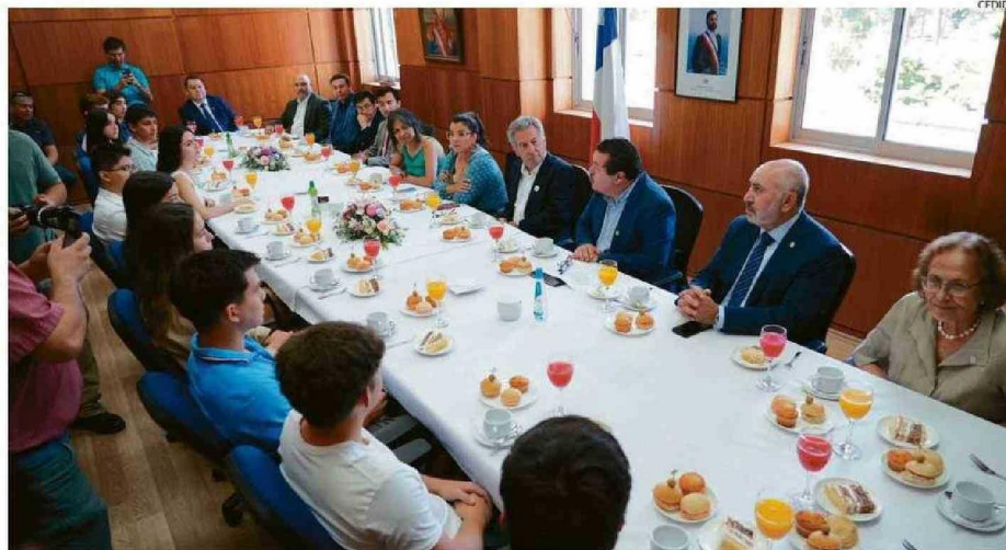
JÓVENES RECONOCIDOS POR SU TRAYECTORIA EDUCATIVA Y RENDIMIENTO EN LA PAES COMPARTIERON DESAYUNO.

12 estudiantes de tres comunas de Ñuble fueron destacados por su trayectoria y rendimiento en la PAES.