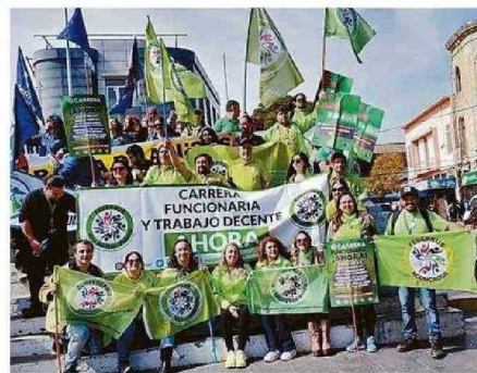
HOY A LAS 10 DE LA MAÑANA HARÁN DENUNCIA Y CONFERENCIA.