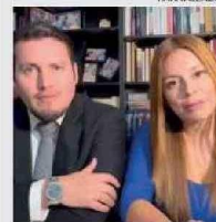
LOS ABOGADOS DE LA FUNDACIÓN.