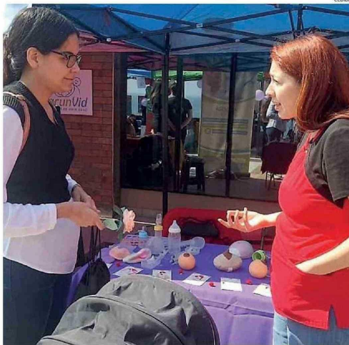
EN LA EXPO EXPLICARON LOS BENEFICIOS DE LA LACTANCIA MATERNA EN MADRES Y NIÑOS.

Cabe señalar que la Semana de la Lactancia Materna implica la materialización de una serie de actividades alusivas a la temática que se desarrollan en las distintas Comunas, organizadas por los Comités locales de Lactancia de cada establecimiento de salud y acompañado a esto se realiza la ya tradicional EXPO Lactancia, instancia en la cual las instituciones pú-