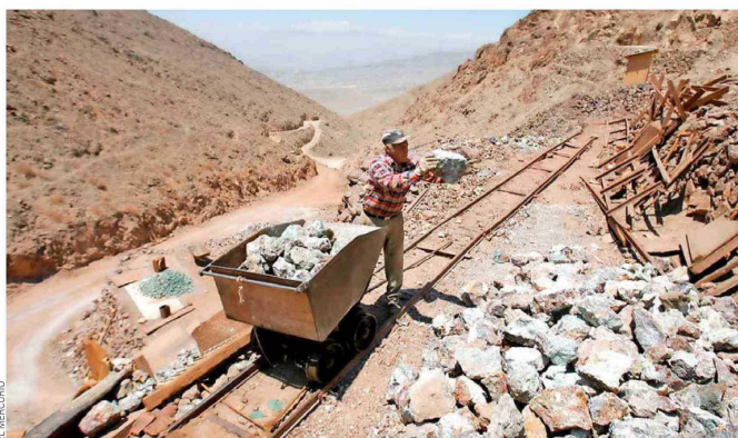
La promulgación de la Ley N°21.649 aporta certeza a la pequeña minería, ya que mantiene los montos de las patentes mineras que estén siendo trabajadas.

La secretaria de Estado señala que el fomento a este sector es una tarea prioritaria para el gobierno, especialmente por su papel clave como motor de economías locales y responsable de cerca de un 3% del empleo que genera la industria minera.