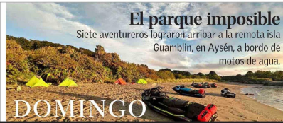
El parque imposible Siete aventureros lograron arribar a la remota isla Guambin, en Aysén, a bordo de motos de agua. DOMINGO