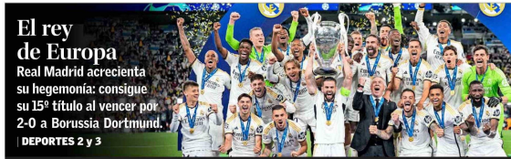
El rey de Europa Real Madrid acrecienta su hegemonía: consigue su 15° título al vencer por 2-0 a Borussia Dortmund. DEPORTES 2 y 3

FUNDADO EN SANTIAGO EL 1 DE JUNIO DE 1987 / ASO CECYU N° 44.864 (ES PROPIEDAD)