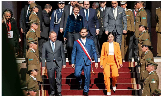
Después de entregar un discurso de 2 horas y 45 minutos ante el Congreso Pleno, el Presidente Boric se retira en compañía de los titulares del Senado y la Cámara, José García Ruminot y Karol Cariola. El jefe de Estado fue aplaudido 123 veces durante su alocución, en una ceremonia que terminó con sillitas vacías de congresistas de oposición, que se retiraron tras los anuncios sobre eutanasia y ampliación del aborto.

• Sin embargo, el mandatario también envía señales a su electorado y orienta la campaña de sus partidarios con anuncios sobre ampliación del aborto y eutanasia, entre otros.