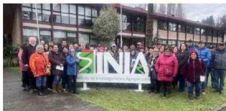
ESTUDIANTES Y PRODUCTORES SE REUNIERON EN INIA CARILLANCA.

La muestra contó con exhibiciones de los programas de mejoramiento genético de trigo, avena y legumbres; un recorrido por el Laboratorio de Calidad de Trigo, y por líneas transversales de apoyo a la in-