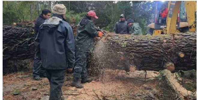
MUNICIPALIDAD DE CUNCO