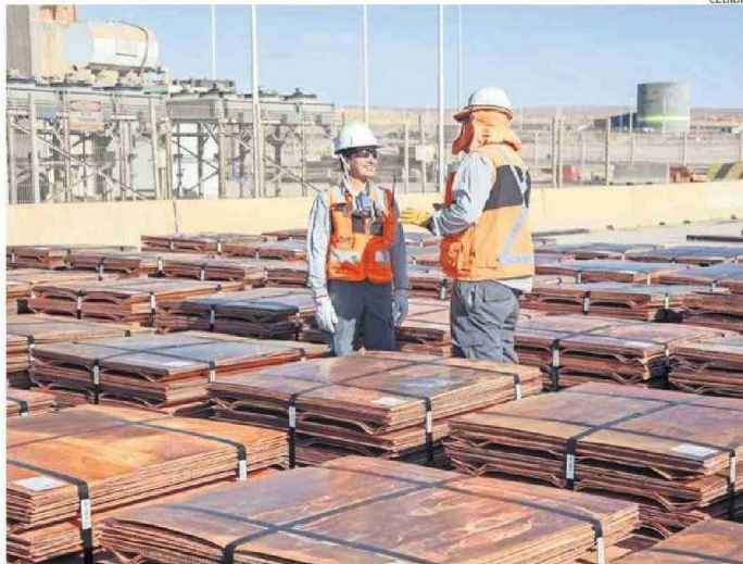
EL DISEÑO DEL ESTUDIO DE IMPACTO AMBIENTAL DEL PROYECTO DE GABRIELA MISTRAL COMENZÓ EN EL 2023.

Como parte de este proceso, DGM incorpora el procesamiento de minerales lixiviables mediante la adición de cloruro de sodio, a partir del 2035, para la cual se deberá construir una planta de salmuera, así como realizar modificaciones en la planta de electro obtención. Lo que generará nuevos flujos de transporte de sal, manteniendo el transporte bimodal de ácido y cátodos de cobre