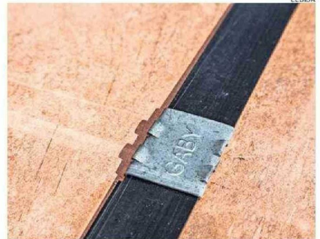
EL ESTUDIO PROYECTA UNA TASA DE PRODUCCIÓN DE 150 MIL TONELADAS.

110 km al sureste de Calama, en la comuna de Sierra Gorda, se emplaza la división Gabriela Mistral de Codelco.