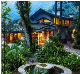
83 villas de adobe componen este proyecto, que reforestó cinco hectáreas.