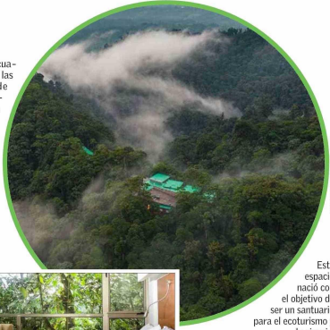
Este espacio nació con el objetivo de ser un santuario para el ecoturismo y la ciencia.