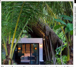
El resort presenta un compromiso con las prácticas sostenibles y el patrimonio cultural y natural del lugar.