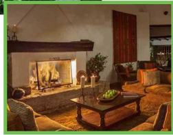
Las tradiciones andino se expresan en su interior.

A los pies de la majestuosa ciudadela de Machu Picchu, el Inkaterra Machu Picchu Pueblo se alza como un santuario de sostenibilidad y lujo. Enclavado entre los Andes y la selva, este refugio ecosostenible abraza la naturaleza en su estado más puro, ocupando cinco hectáreas de terreno reforestado, donde antaño reinaban cultivos de té y café que arrasaron con la biodiversidad local. Hoy, ese suelo recuperado florece como un vibrante ecosistema, hogar de árboles, aves y plantas autóctonas.