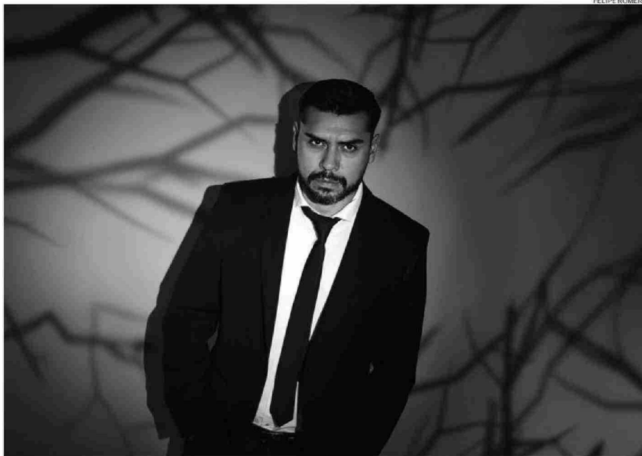
"ME DEMORO MUCHO EN INVESTIGAR, MESES, INCLUSO HASTA UN AÑO ESTOY INVESTIGANDO PARA MIS PROYECTOS", DICE EL AUTOR.

"Todos mis libros se basan en investigaciones. Yo no me demoro mucho en escribir, lo mío es la narrativa breve, me gusta como formato la nouvelle (narración entre el cuento y