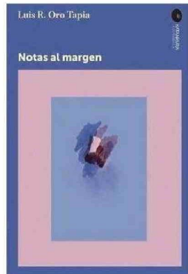
EL LIBRO "NOTAS AL MARGEN" REFLEXIONA SOBRE EL MOMENTO POLÍTICO Y SOCIAL ACTUAL Y SOBRE EL ROL DE LA GENERACIÓN DE LOS 80.