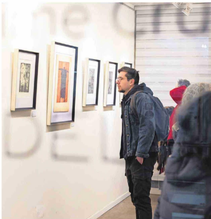
Todas las obras de la muestra son de los inicios del artista en los años 60.

La muestra "Memoria del mutante" reúne diversas obras del célebre grabador penquista y también festeja los 15 años de la galería.