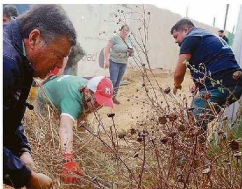
DESMALEZÓ JUNTO A VECINOS, PERSONAL MUNICIPAL Y DE CONAF.

han sido cuestionadas, especialmente desde la oposición- Valenzuela señaló que "yo he pedido que la Conaf vea si puede tener un sistema de polinomio". En este, planteó, que un componente sean las horas extra, pero que se sume a la consideración de otros parámetros, entre otros, labores de prevención, construcción