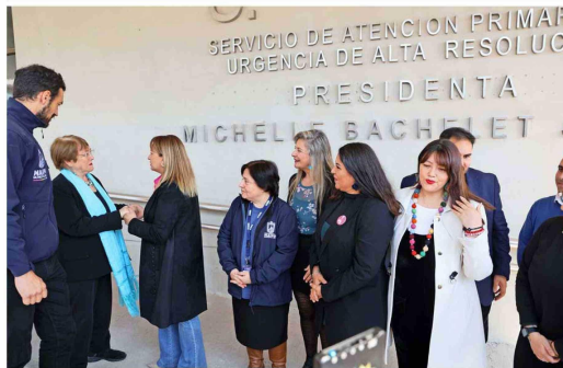
EXMINISTRO PARIS: "LAS LISTAS DE ESPERA PODRÍAN SER AUN MAYORES Y YA SON UNA GRAVE CRISIS" | C 1

Acusan intervencionismo por acto con Bachelet