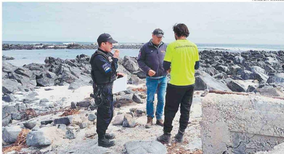
"ESTAS FISCALIZACIONES BUSCAN PREVENIR LOS DELITOS, PERO TAMBIÉN FORTALECER LA PRESENCIA DEL ESTADO DONDE MÁS SE NECESITA", DIJO EL DPP.

FISCALIZACIÓN. El operativo fue ejecutado por la Armada, Carabineros, el Servicio Nacional de Pesca y Acuicultura (Sernapesca) y Seguridad Pública de la Municipalidad de Chañaral. El procedimiento estuvo focalizado desde caleta San Pedro de Chañaral hasta Torres del Inca, lado sur de la capital provincial.