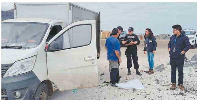
EL OPERATIVO CONJUNTO RESPONDE A UN MANDATO PRESIDENCIAL DE FORTALECER LA SEGURIDAD.