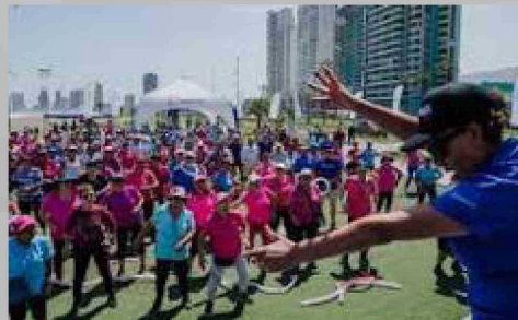
El deporte y la recreación contarán con más programas a desarrollar el 2025.

En 2025, la creación de la nueva Secretaría Regional Ministerial de Ciencia, Tecnología, Conocimiento e Innovación abre una valiosa oportunidad para potenciar el trabajo que ya realiza el Ministerio del Deporte (Mindep) y el Instituto Nacional de Deportes (IND) en Tarapacá. La Seremía del Deporte espera establecer vínculos directos y estratégicos con esta nueva secretaría, promoviendo la aplicación de tecnologías avanzadas en áreas clave como el entrenamiento de alto rendimiento, particularmente en el programa Promesas Chile. Este esfuerzo conjunto no solo buscará optimizar el desarrollo físico y técnico de los más de 16.000 beneficiarios de los programas deportivos regionales, sino también fortalecer el apoyo a los 73