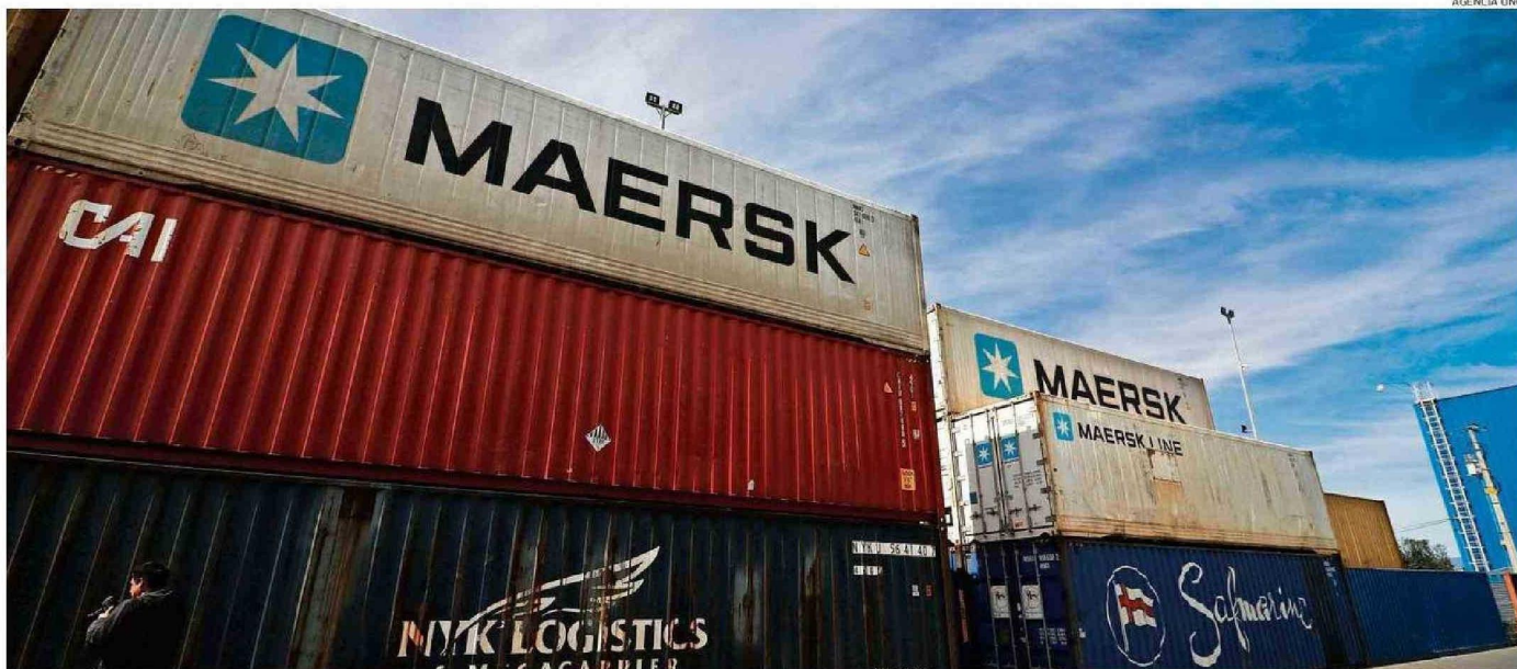
FRUTICULTORES LOCALES INICIAN LAS EXPORTACIONES A PARTIR DE NOVIEMBRE. POR ELLO, ESPERAN QUE MOVILIZACIÓN EN PUERTOS NO SE EXTIENDA HASTA ESA FECHA.