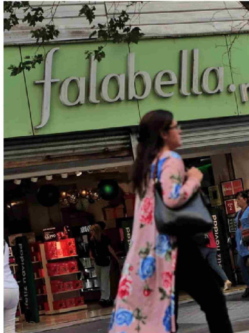
Falabella logró ganancias de US$97,5 millones en el tercer trimestre del año.