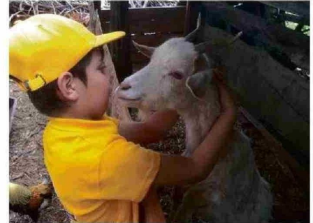
EN LA GRANJA EL RINCÓN DE ARTURITO HAY VARIEDAD DE ANIMALES.

Otro aspecto esencial para el éxito de estos emprendimientos es la difusión que se realiza en ferias asociadas al mundo rural, ubicadas en el corazón de las ciudades, como las plazas de Osorno, Puerto