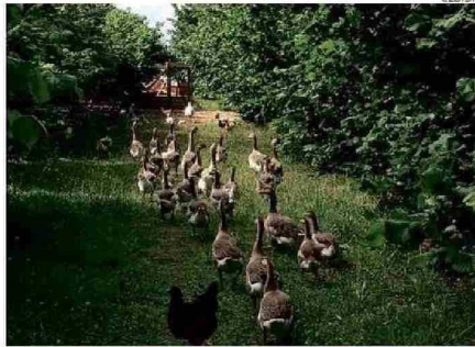
EN EL RINCÓN DE ARTURITO LAS AVES SON PARTE DE LA GRANJA.

"Todo lo que hemos construido aquí ha sido transportado en embarcaciones. Contamos con tinajas, espacios con duchas termosolares, un pequeño negocio de abarrotes, una zona de cabañas, arriendo de kayaks, paseos en lancha y, lo más importante, todo esto sin alterar la naturaleza viva de esta zona. Las personas que nos visitan buscan desconectarse de la agitada vida de las grandes urbes, y aquí encuentran esa paz. Este lugar es una bendición, algo que fue forjado principalmente por mis abuelos, especialmente mi abuela, quien falleció hace dos años a los 108 años. Su vida fue tan longeva porque era una mujer trabajadora, bondadosa y vivió rodeada de naturaleza toda su vida. Con su generosidad, qui-