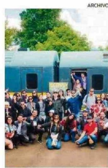
EL TREN VIAJÓ EN NOVIEMBRE.