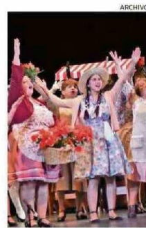
ESTRENO EN TEATRO CERVANTES.

● Tren al Sur - Fluvial Musical El encuentro para la promoción y el desarrollo de la industria musical chilena tuvo una importante innovación en noviembre del año pasado, al reactivar el tren entre Santiago y Antihue. Fue un viaje en el que participaron artistas y agentes del sector que llegaron a Los Ríos; y que además sirvió para potenciar el turismo, los emprendimientos de Valdivia y el perfil musical de la ciudad.