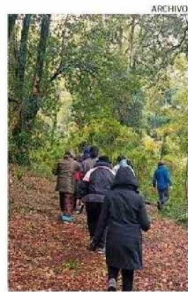
PARQUE URBANO EL BOSQUE.

● Ex Cárcel Isla Teja Edificación que funcionó como recinto penitenciario y que en 2018 fue declarada Monumento Histórico, gracias al trabajo de articulación social liderado por la Agrupación de Ex Presos Políticos y Familiares de Valdivia. Hasta la fecha la institución se ha encargado de implementar diversos proyectos relacionados con la memoria, como recorridos guiados y el rescate de archivos y documentos.