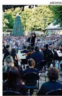
CONCIERTO "EL MESÍAS".