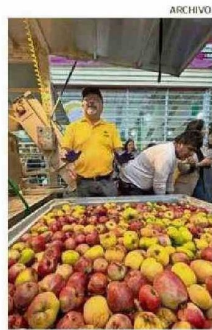
EL EVENTO DEBUTÓ EN 2024.