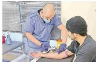
Las personas participantes tuvieron que dar una muestra de sangre para evaluar las secuelas inmunológicas de la enfermedad prolongada.