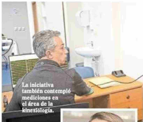
La iniciativa también contempló mediciones en el área de la kinesiología.