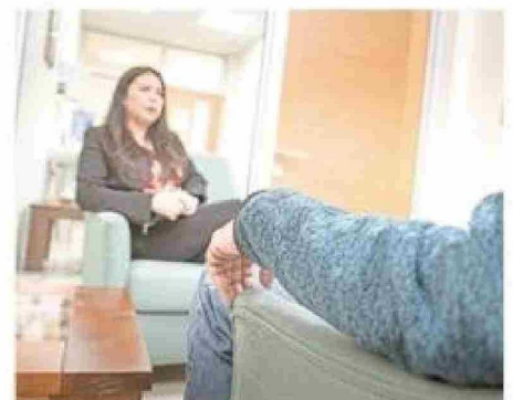
El proyecto incluyó mediciones en el ámbito psicológico.

De cara al futuro, el Cadi-Umag proyecta expandir su trabajo en el estudio del Long Covid, fortaleciendo redes internacionales de colaboración y compartiendo datos con bases globales. Actualmente, una de sus investigaciones está en proceso de publicación en una revista internacional, consolidando el rol del centro como referente en la investigación de las secuelas del Covid-19.