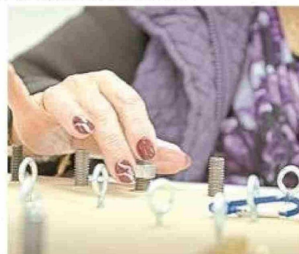
Las mujeres de entre 30 y 64 años son las más afectadas con la alta prevalencia del Long Covid en Magallanes.

Cadi-Umag: Una historia de lucha contra el Covid-19 desde el diagnóstico hasta la rehabilitación