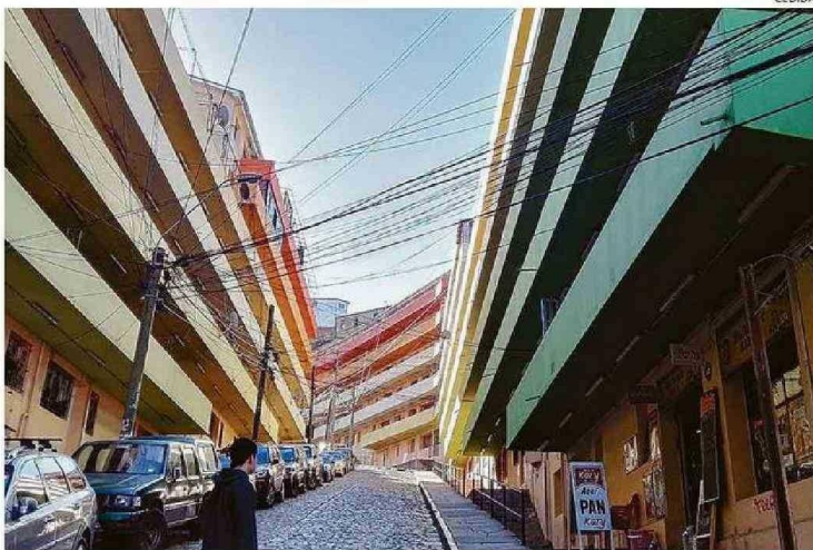
"POBLACIÓN MÁRQUEZ" (2018) SURGE TRAS UNA INVESTIGACIÓN UNIVERSITARIA DE LA UV.