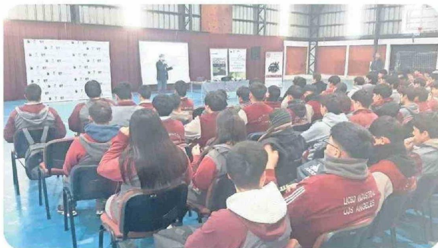
Más de 650 estudiantes de la carrera de mecánica de Liceos Técnico Profesionales fueron capacitados en electromovilidad.

Título: Gore Biobío y USM cierran electromovilidad exitoso proyecto sobre