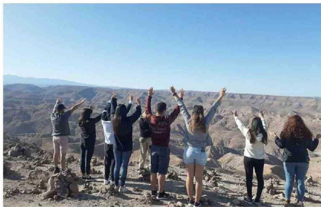
EN EL CAMINO AL VALLE DE CODPA SE PUEDEN ENCONTRAR LAS APACHETAS. (MONTÍCULOS DE PIEDRAS)

Ante los trabajos que realizó el MOP en la ruta A-353; que une Codpa con el salar de Surire, estos recibieron la aprobación de los emprendedores. "En esta ruta se realizaron obras de conservación y ha quedado en muy buenas condiciones para la seguridad de los habitantes y también para quienes desarrollan turismo entre la precordillera y el altiplano.