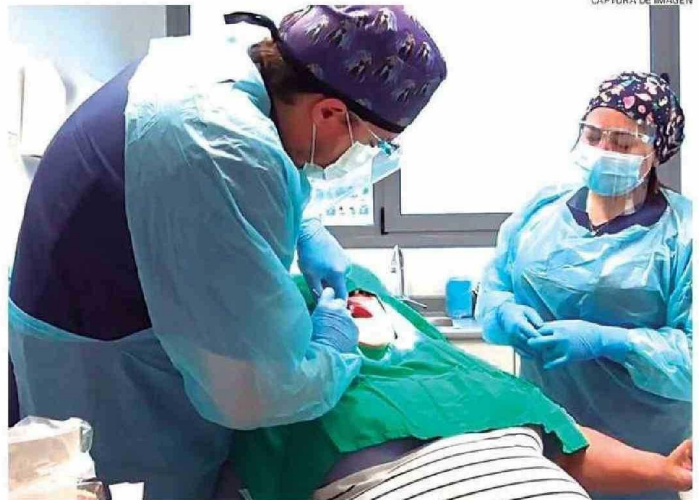
CAPTURA DE IMAGEN

“Estimamos que estas horas serán asignadas en un plazo corto, toda vez que proteje-