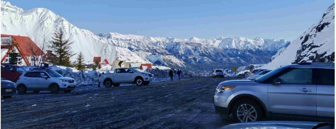
LAS AUTORIDADES DIERON EL VAMOS a la campaña “Antuco como nunca antes”.

En un trabajo conjunto con Sernatur, Gobierno Regional y Conaf, presentaron la campaña con la finalidad de dar a conocer la oferta turística de la comuna.