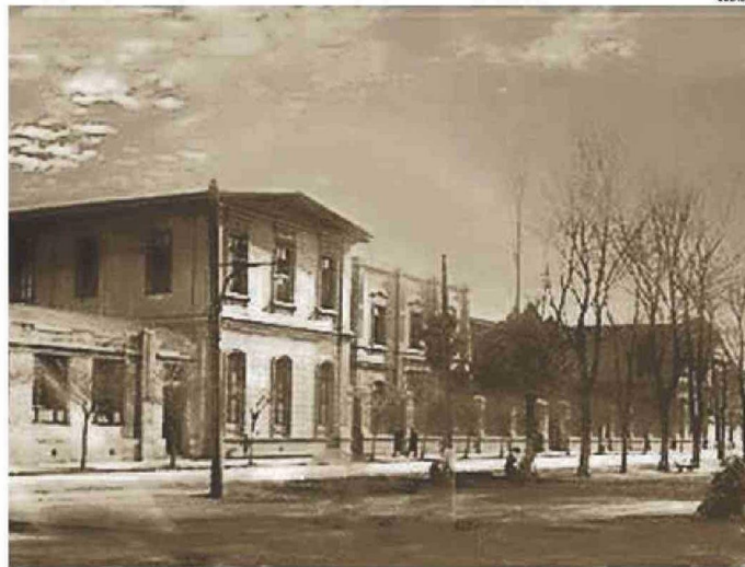
IMAGEN DE LA ANTIGUA ESCUELA NORMALISTA DE CHILLÁN, LA MÁS CERCANA A CONCEPCIÓN.

con 50 años de labor educacional. Así éramos los normalistas, nosotros ya en la época de secundaria salíamos a hacer clases a sectores rurales, al campo, con 18 años. Nos formaron para ser profesores, desde que ingresamos a la escuela normal, sabíamos que