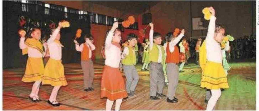
La presentación del primero A "Pimpollo".

La Muestra Folclórica no sólo cumplió el objetivo de difundir las tradiciones chilenas entre los más pequeños, sino que también fortaleció el sentido de comunidad y trabajo en equipo.