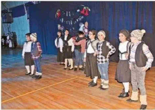
La presentación de los alumnos de cuarto básico A "Flamenco".