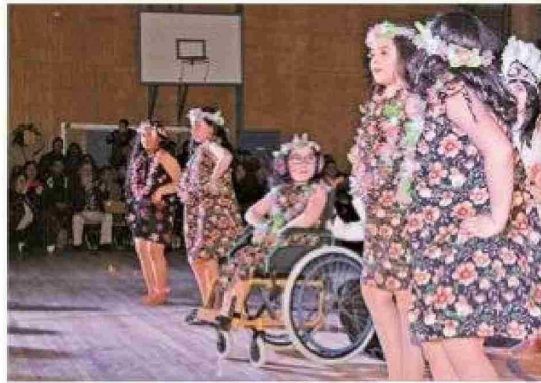
La presentación de los alumnos de cuarto básico B "Colegial".