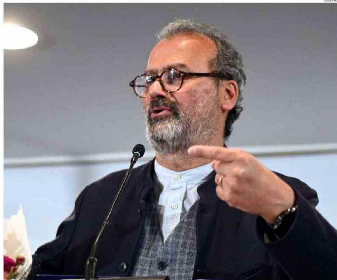
EL GOBERNADOR VALLESPÍN ACORDÓ FIJAR PARA EL 30 DE DICIEMBRE LA SESIÓN PARA APROBAR EL PRESUPUESTO.

sostuvieron que el proyecto no se bajará y que será incorporado en la propuesta de presupuesto que se votará el 30 de diciembre.