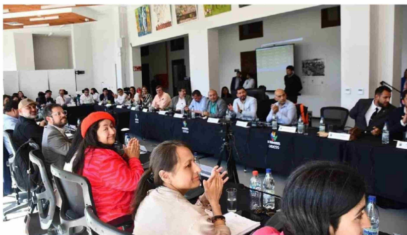
LA APROBACIÓN DE LOS RECURSOS por parte de los consejeros regionales fue unánime.