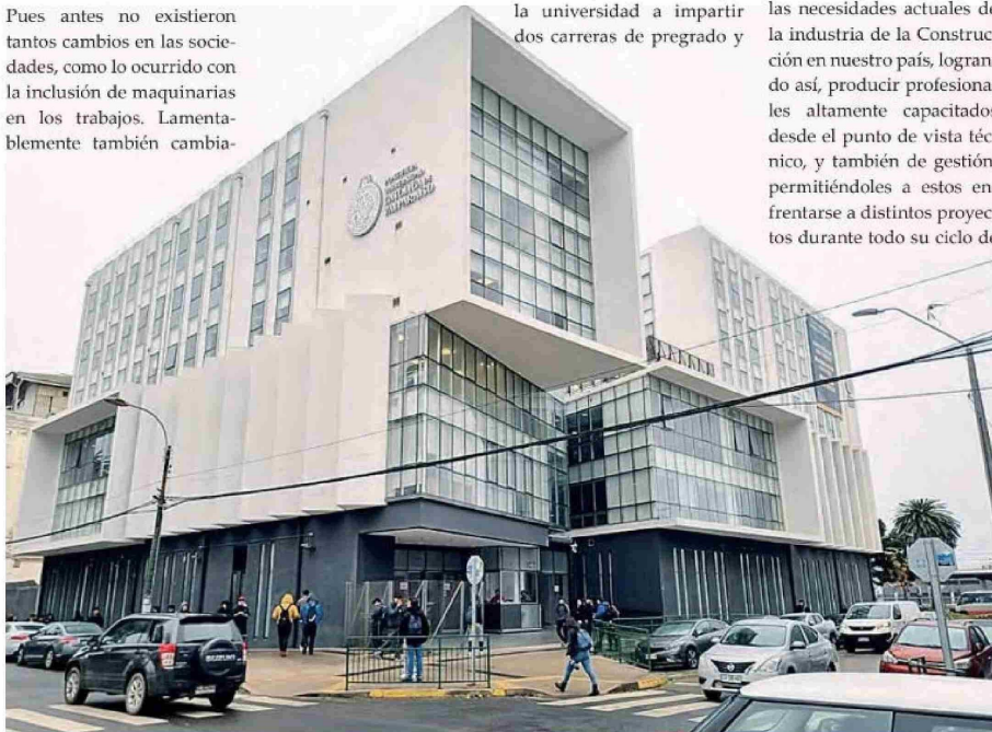
La Escuela de Ingeniería en Construcción y Transporte forma parte de la Facultad de Ingeniería de la Pontificia Universidad Católica de Valparaíso. Se encuentra ubicada en Avda. Brasil N° 2147, esquina General Cruz, Edificio ICT, Valparaíso, Chile.

“El Observador” tuvo la oportunidad de conversar