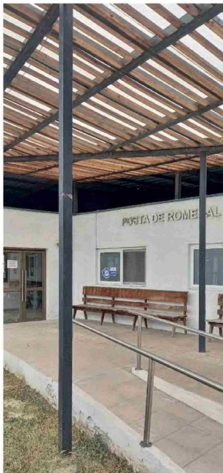
La actual y moderna Posta de Salud Rural de Romeral, donde ahora trabaja un completo equipo de salud primaria.